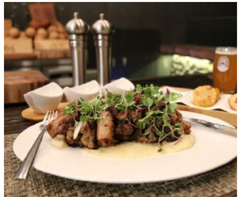
Mixed Meat 모듬 육류 꼬치

Grilled baguette 그릴드 바게트 ₩ 4,000 Vegetable fried rice 야채볶음밥 ₩ 5,000 Mashed potatoes 매쉬드 포테이토 ₩ 6,000 Sautéed mushrooms 볶은 버섯 ₩ 6,000