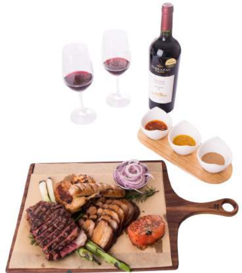
BBQ Platter (For Two)